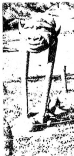
Águas Claras ainda está para ser descoberta por crianças, jovens e adultos