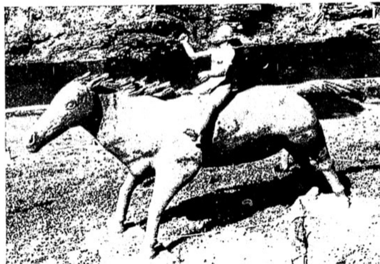
Todos os personagens foram erigidos em cerâmica oca, no tamanho natural, segundo aparecem nos livros de Lobato.