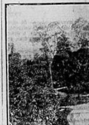
Um recanto do Jardim Publico

mais bello tem a Escola Normal Livre ao seu lado... E' lá que fazem o cinema de Pinda. Ao longo, alvres, vão sobrando revistas cinematographicas, para as aulas... São como as nossas normalistas da praça da Republica: interessantes, grandemente, pela vida dos artistas de cinema e não ha uma que não conheça, em todos os seus detalhes, a vida de John Gilbert, Laumon Novarra, etc.