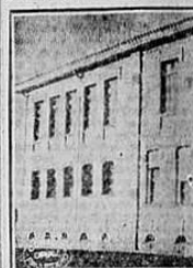
Cadeia e Forum

Na pharmacia — ah, aqui chegamos a conhecer a vida da cidade! — estão reunidos os principais nomes da cidade. Falamos de tudo. E em todos os assa-